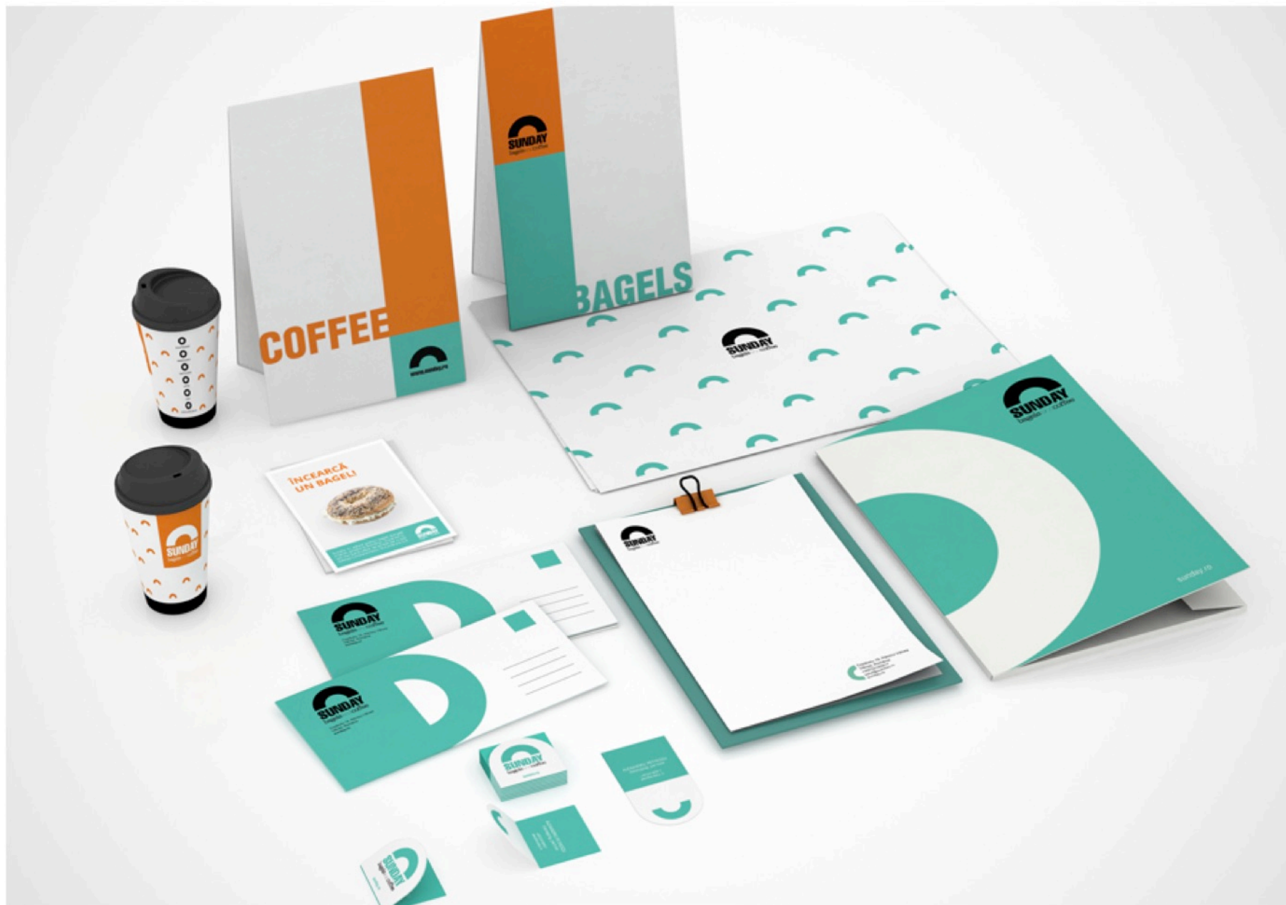
Impression de supports publicitaires, papeterie d'entreprise personnalisée.