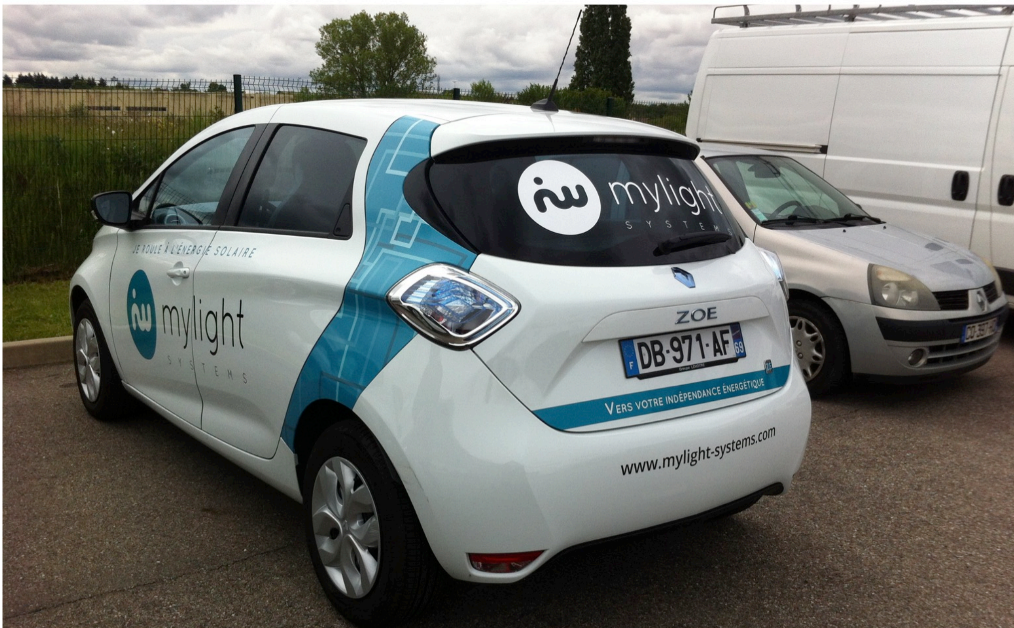
COVERING DE VEHICULE : design, impression et pose sur site pour ALASKA ENERGIES group à Lyon