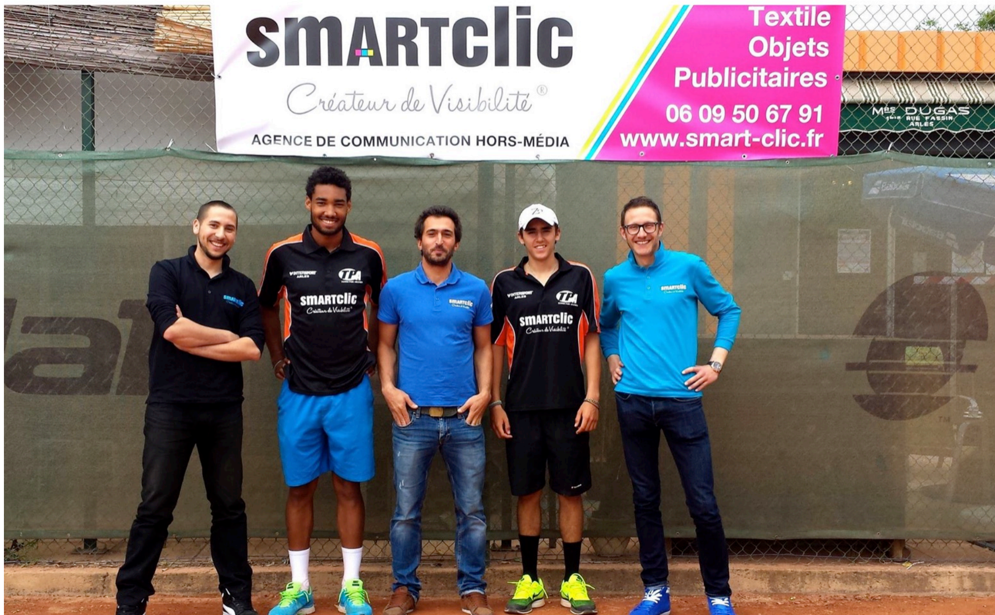
TEXTILE PUBLICITAIRE : design et conception de vêtements de sport pour le TENNIS PARC ARLESIEN