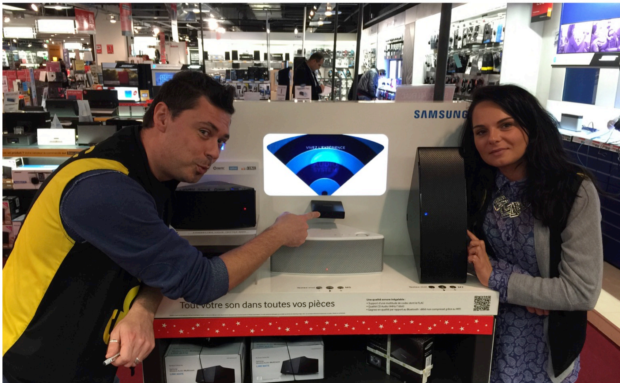
Design, production et déploiement d'une solution PLV interactive dans 200 magasins FNAC, BOULANGER, DARTY, pour SAMSUNG AUDIO France