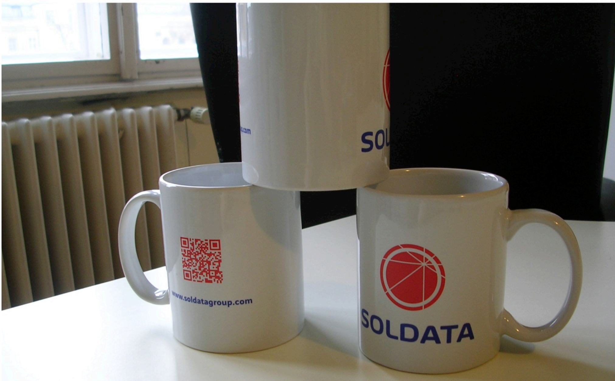
OBJET PUBLICITAIRE : design & production de mugs pour SOLDATA groupe VINCI à Nanterre (92)