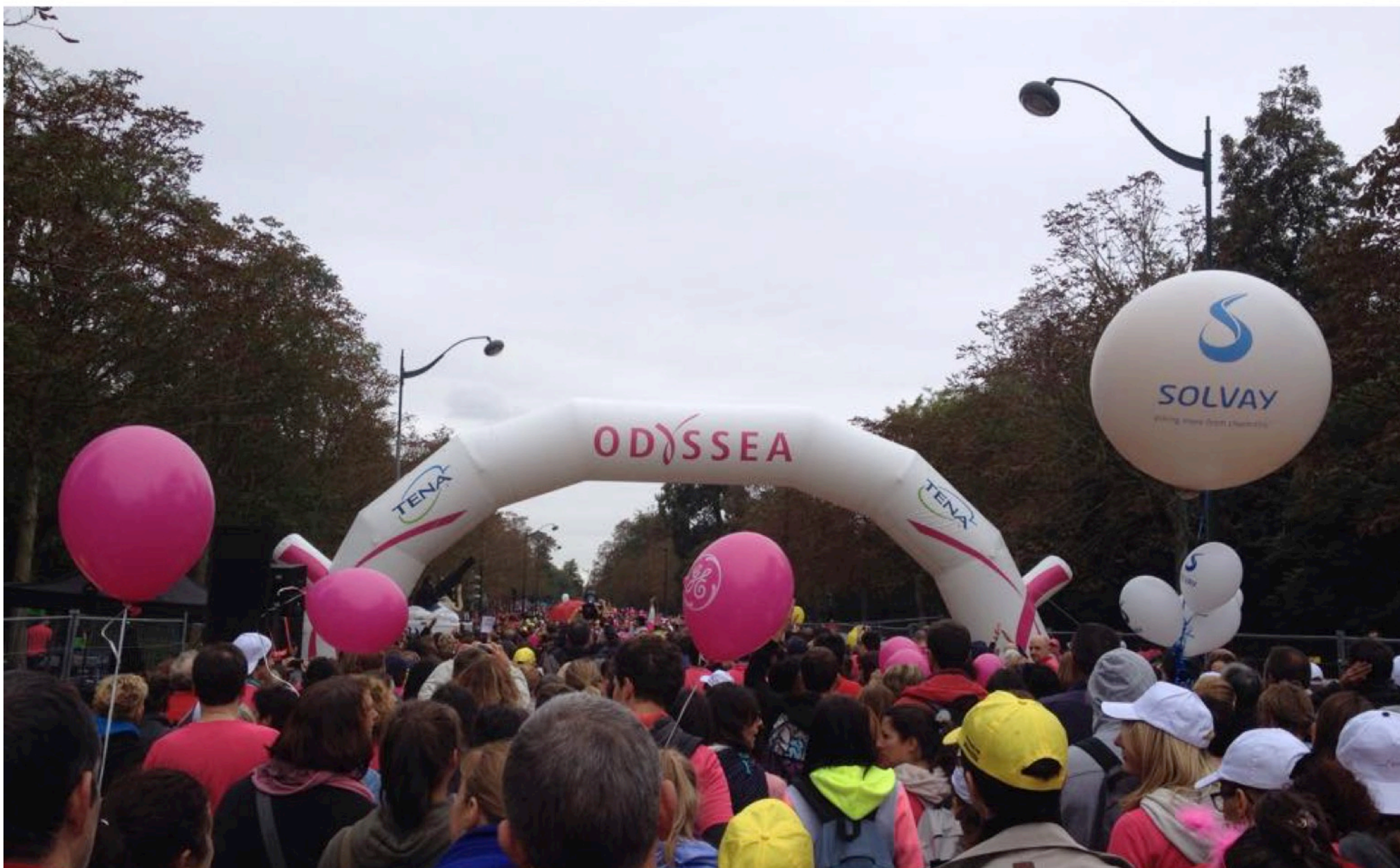
SIGNALETIQUE EXTERIEURE course ODYSSEA Paris