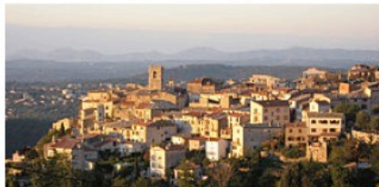
SAINT JEANNET (fr)