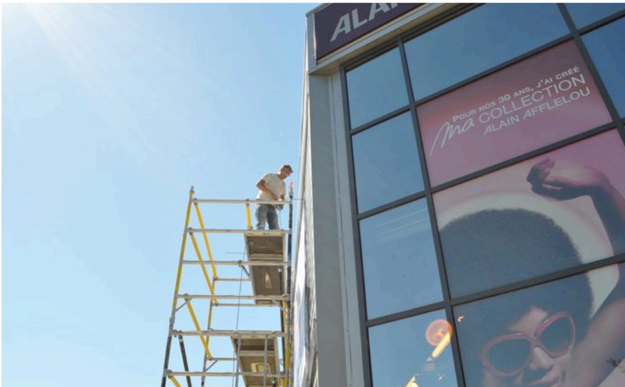
AFFICHAGE EXTERIEUR : design, impression et pose d'une bâche grand format pour Alain AFFLELOU Arles (13)